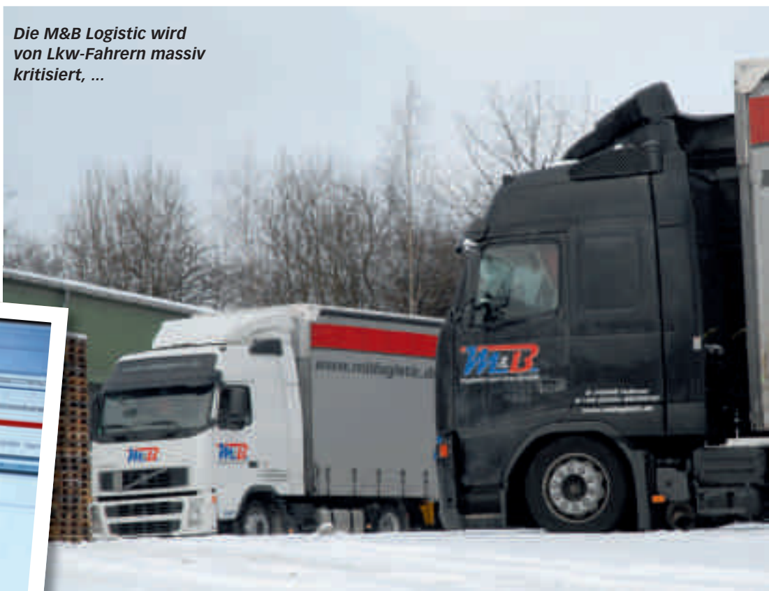
Die M&B Logistic wird von Lkw-Fahrern massiv kritisiert, ...

„Um etwaige Missbrauchsmöglichkeiten der Jobbörse auf ein Minimum zu reduzieren, prüfen wir täglich grundlegend und systematisch die Arbeitgeber und die Angebote, die sie selbst mittels PIN-Code in die Jobbörse einstellen.“