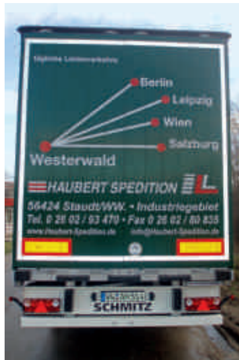
Auf dem Heck der Sattelzüge wirbt Haubert für die regelmäßigen Relationen.