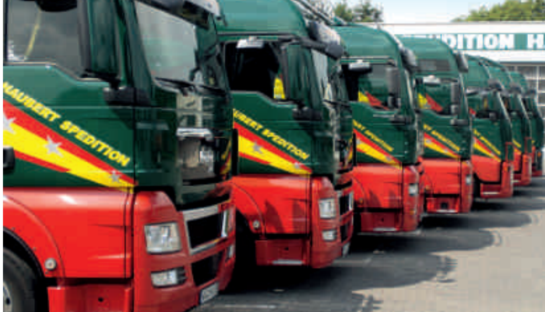
Die kleine, hochmoderne Flotte besteht aus Volvo und MAN mit Euro-5-Technologie.

Unternehmen ist es extrem schwierig, sich auf die Minute genau an die Sozialvorschriften zu halten.“