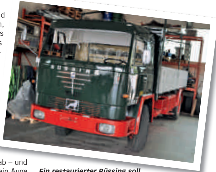
Ein restaurierter Büssing soll an die „gute alte Zeit“ erinnern.

Fast jeder ältere Fahrer kennt eine Anekdote über das damalige menschliche Ermessen von Polizei und BAG, die auf einen Blick erkannten, ob es vor allem ausreichend Pausen auf der Scheibe gab – und bei kleineren Verstößen schon mal ein Auge zudrückten, vor allem wenn es auf der Heim-