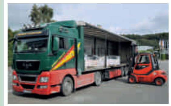
Schwerpunkt ist die Fliesen- und Keramiklogistik.